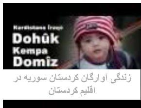
زندگی آوارگان کردستان سوریه در اقلیم کردستان