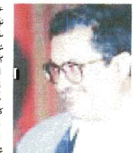
عقوبات ریخته نشود برای کسانی که در جریان انتخابات به تبلیغ برای خاتمی پرداخته اند. این افراد به دادگاه خواهند رفت.

عقوبات ریخته نشود برای کسانی که در جریان انتخابات به تبلیغ برای خاتمی پرداخته اند. این افراد به دادگاه خواهند رفت. خاتمی در نامه‌ای که به رئیس قوه قضائیه ارسال کرده است، خواسته که این افراد را مورد بخشش قرار دهد. او می‌گوید: «ما در این انتخابات فقط برای خاتمی رأی دادیم، اما این کار را به شکلی انجام دادیم که باعث شد آنها را به دادگاه بکشند. این کار را فقط ما نمی‌کنیم، بلکه مردم هم در جریان انتخابات به تبلیغ برای خاتمی پرداخته اند. ما می‌خواهیم که این افراد را مورد بخشش قرار دهیم و به آنها فرصت دوباره بدهیم.»