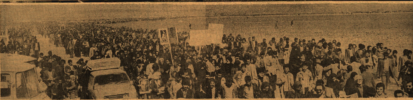
جاده احمدآباد سالها برای باران مصدق ممنوع بود، بندهی تاجدار سلطانیت افتد که جاده تا این خالی ماند و مزار مصدق را غبار فراموشی بگردد. ملت، اما سوز داشت و بندگی تاجدار گریخت و درباری خلق بسوی آرامگاه آزادمردی روان شد که فضیلت هفت گشته به نظردان جهان راه مآموخت. دیروز احمدآباد دیگر بیانیسی خاموش نبود، غلظه بود و رفته‌ای به پایان از مردان و زنان آزاده - که رفتند تا مزار مصدق را ببینند.