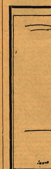
طرح از گابریل درویش