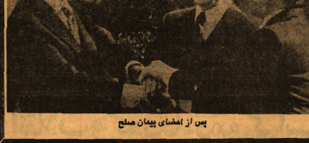
پس از امضای پیمان صلح

بنا به تها کسی که می توانست اسرائیل را رها بنا به تها کسی که می توانست اسرائیل را رها بنا به تها کسی که می توانست اسرائیل را رها