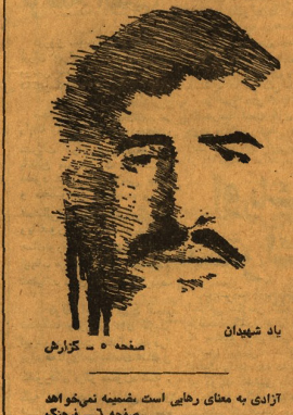
یاد شهدای آزادی به معنی رهایی است ضمیمه نمی‌خواهد

اسلام‌آباد - خبرگزاری فرانسه - در اسلام‌آباد اعلام شد در دومین کنفرانس وزیران کشورهای اسلامی که در اسلام‌آباد پاکستان برگزار می‌شود، در روزهای آینده گشایش می‌یابد.