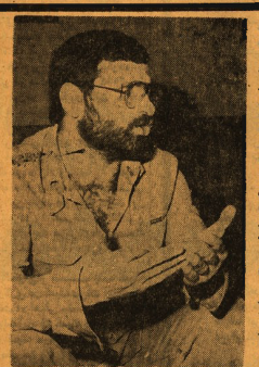
نظر بیانیه برخی از خوانندگان ما طی تماس هانی که با روزنامه میگذشت، مبنای اصلی ما در طرح نمودن این پرویز...

گهی بارقلیج خانی «کایتان پیشین تیم ملی فوتبال ایران»