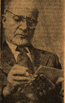
من طرفان دگرگونی های بزرگ نیستیم

ما قصد داریم بودجه نظامی را فوق العاده کاهش دهیم و طرح های بزرگ را حذف کنیم.