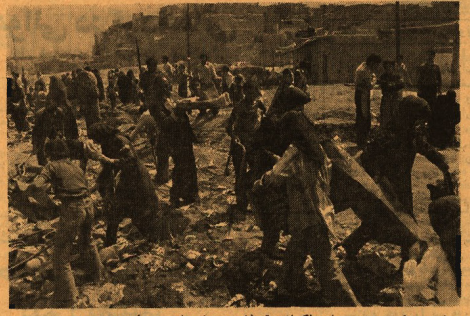
جنبو چوهر مردم سرای پاکسازی تهران، در جنبویشر بسیار دیدنی بود. علاوه بر افرادی که در پاکسازی شرکت داشتند.

مورد دیگر اختلاف طرح تصویب شده دولت و طرح کارگران بیکار شورش است که در بزرگ بازار تهران ۱۳ اسفند ۶۰ میلادی نیز منتشر شد.