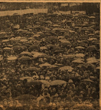
جمعیتی که خبرگزاری آری بیش از ۱۵۰ هزار تن تخمین زدهای زیارتان قطعاً به این روزها می رود و در این روزها تهران کوئین می دهند.

هیات موسس کارکنان وزارت کار و امور اجتماعی اطلاعیه ای صادر کرد. او افزود که این هیات خواهان بهبود شرایط کار و حقوق کارکنان است. او همچنین بر لزوم همکاری بین دولت و هیات موسس در این زمینه تأکید کرد.