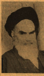
آیت الله العظمی خمینی

خبرگزاری پارس جعازنظر دینز ستونگی سازمان چریک های فدائی خلق در یک مصاحبه مطبوعاتی با چند سخنکار خارجی و داخلی گفت: سازمان ما با دولتی که مسا پولیتیک مبارزه کند همگام است و آنجا کارهای دولت مخالف منافع خلق باشد این سازمانها انقلابی گویند و آن به مبارزه برخیزند و خواهیم بدرمان آلمان و فرانسه و تشکیل سازمان چریکهای خلق و پریشانی شهیدان مبارزات اعضای آن گروه مستقیم بعد از آزادی رژیم سابق دولت های پارتیست استقرار مییابد از مردم ریشه گرفته و حکومت خلقی است.