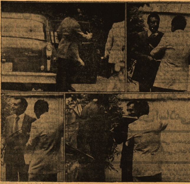
در عکس های بالا که به وسیله کنسولجه لیبوریک و از راه دور گرفته شده است مصور فریخ زاده را (با لباس سفید) می بینید. وی رئیس شعبه ساواک در آمریکا بود و در پهنه یخبندان از اعضای هیئت نمایندگان ایران در سازمان ملل متحد فعالیت می کرد.