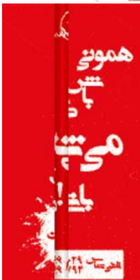
بانگاه اطلاع رسانی عشایر ایران