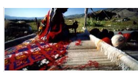
نقش و نگارهای قالی اردبیل دوباره جان می‌گیرند ۰۵ بهمن ۱۳۹۲