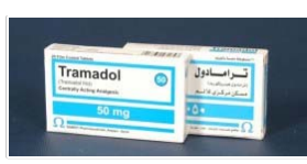
مصرف بی رویه ترامادول در پارس آباد نگران کننده است ۰۶ بهمن ۱۳۹۲