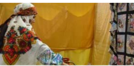
از آتش دوغ اردبیل تا ست کامل منقل در نمایشگاه شب چله + تصاویر