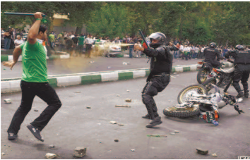
یکی از عکس‌های مانتی که در مجموعه عکس برگزیده ورلد پرس فوتو قرار داشت

«یک نفر دوربین‌ام را در یک کیسه پلاستیکی وسط جمعیت برد و من مثل یک توریست وارد جمعیت شدم. دوربین‌ام را گرفتم و مشغول عکاسی شدم. مردم کمک می‌کردند تا عکس بگیرم.» این آغاز چهار روز عکاسی از اعتراض‌های خیابانی در تهران بود. عکس‌هایی که توسط دوربین اولیویه لیان مانتی، ثبت شد.