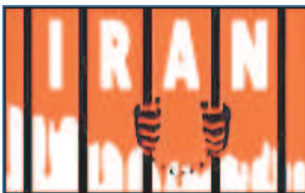
برنامه ای از تلویزیون بی بی سی فارسی

انتشار خبر اعدام معترضین در ایران ، نگرانی ها در مورد موج جدید اعدام های سیاسی در این کشور را تشدید کرده است.