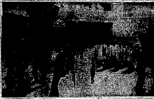
• گروهی از دانشجویان در تهران در جریان تظاهرات علیه رژیم استبداد پهلوی

شرکت نی صدر در اجلاس شورای امنیت به تعویق افتاد