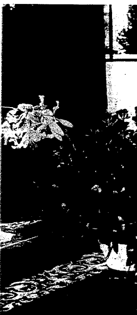
Two bouquets of roses place in

Article in the Ittilâ'ât newspaper, issue number 17101, dated 14 Shahrivar 1362 (5 September 1983) announcing that, 'At the order of the Central Court of the Islamic Revolution, the licenses of 32 Bahá'í attorneys have been withdrawn.'