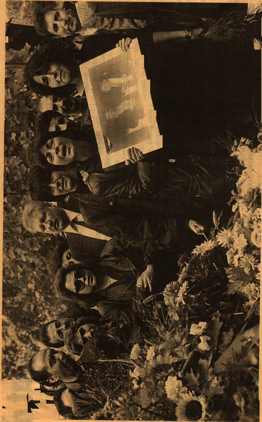
Sept. 1992: N. Dehkan-kurdî, Çepîs, Çîyaykonus-Anschîgê, û şerîkê Berdîgî. Dîyê Wîwêgê de nî. Hêgehên Gencmîenîst an