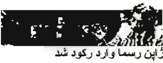
زاین رسماً وارد رکود شد

پولی سرنوشت نامعلوم تحقیق در باره علل ورشکستگی انرون