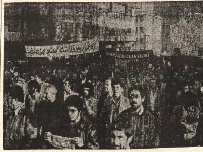
یک صحنه از تظاهرات نامتوازی که علیه امضای قرارداد ننگین صلح بین سادات و بگین صورت گرفت