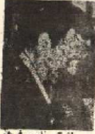
سرلشکر ناصر قره‌نی

● احتمال تغییرات دیگری در ستاد کل ارتش ملی اسلامی ایران می‌رود