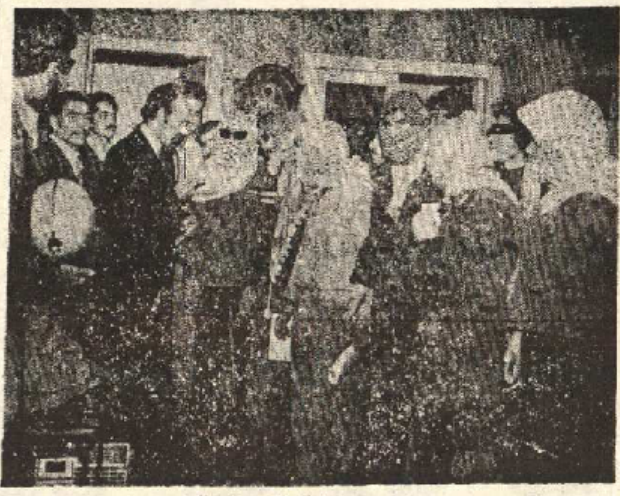
نگاه تعویق سخات مصر از سوی دانشجویان عرب به اردلان نماینده وزارت خارجه ایران. سخاتمه انگلی به از خروج دانشجویان به مقامات مصر...