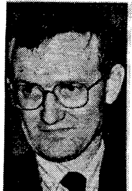
دکتر گلاس هاگ بریتانیا هفته گذشته به جمهوری اسلامی اخطار داد که روابط خود را با ارتش سری