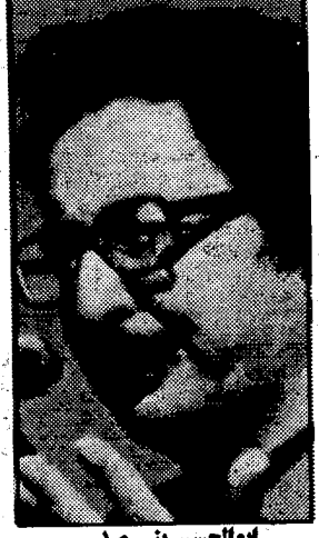
ابوالحسن بنی صدر

در عوض سازمان مذکور می باید ترور سه نفر از مخالفان رژیم را به عهده می گرفت. این سه نفر ابوالحسن بنی صدر، رئیس جمهوری سابق رژیم اسلامی که از سال ۱۹۸۱ در